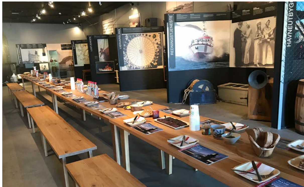
Utstillingen Riksvei 1 på Lindesnes fyr er bygget om og et langbord i eik til 50 personer er satt inn.

Kystverket har ledet arbeidet med forvaltningsplaner for fredete fyrstasjoner i statlig eie. Kystverkmusea bidro i 2018 med historiske tekster til forvaltningsplanene for følgende fyrstasjoner: Kya, Haugjegla, Åsvær, Myken, Anda, Torbjørnskjær, Store Færder, Ryvingen, Lyngør og Grønningen.