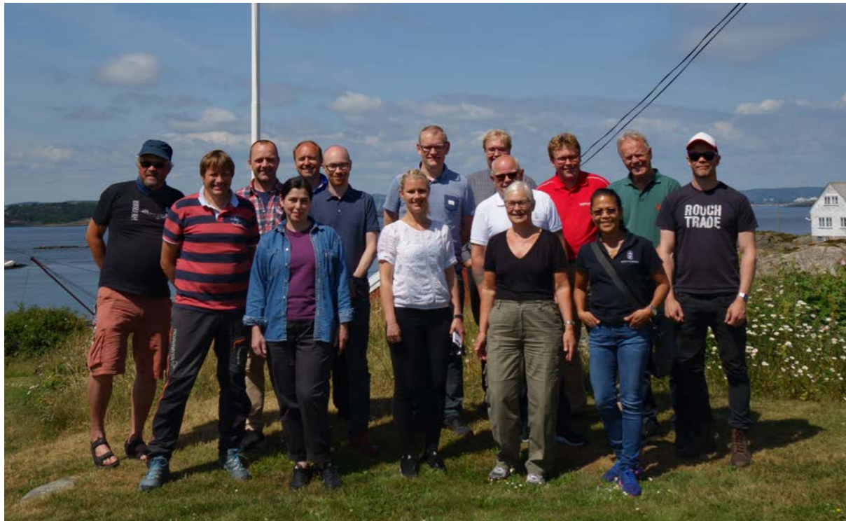
Kystverkmusea og Kystverket arrangerte for tredje gang Oksøyseminaret på Oksøy fyr.

Museumsskipet M/S Gamle Oksøy har vært på tokt til Orknøyene, Shetland, Færøyene og Island. Fartøyet deltok også ved forbundet KYSTEN's landsstevne i Haugesund, Fjordsteam i Bergen, Skalldyrfestivalen i Mandal, og som logiskip og debattarena under Arendalsuka.